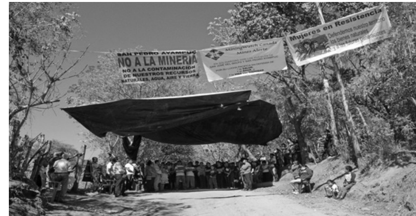
Fonte: Guatemala Human Rights Commission: https://ghrcusa.wordpress.com/tag/la-puya/

As mulheres foram essenciais para que o acampamento se instaurasse e houvesse infraestrutura para tal. Além de estarem presentes nos plantões e vigílias, as mulheres continuaram responsáveis pela comida e pelo cuidado dos espaços, garantindo todas as condições para a luta.