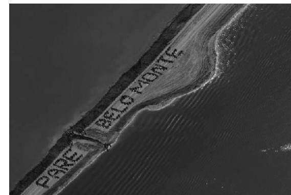
Figura 2 Protesto no Xingu + 23

e ribeirinhos sobre a gestão de seus territórios, a promoção de iniciativas econômicas sustentáveis a partir da manutenção da floresta em pé, e de instrumentos de comunicação e compartilhamento de informações internas e externas da aliança 34 .